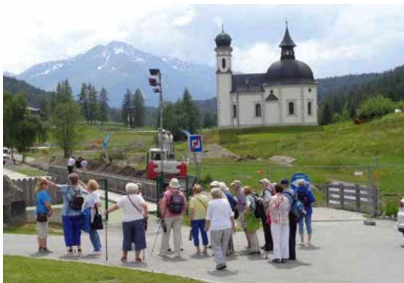
Seniorenferien 2018 in Seefeld

Dem Klischee vom leeren Kirchgemeindehaus zum Trotz werden unsere Räume von vielen Aussenstehenden genutzt. Immer wieder wird die Kirchenpflege dabei um