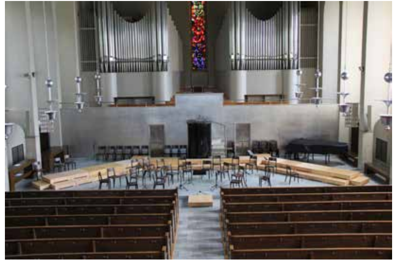
Vorbereitung zu einem Konzert in der Pauluskirche

Christkatholische Gemeinde. Der Reformations-Gottesdienst im November fand im Rahmen des künftigen Kirchenkreises sechs in der Pauluskirche statt. Es war ein feierlicher Anlass, an dem der Paulus-Chor mit Kantor Stephan Fuchs, die Organistin Kyomi Higaki aus