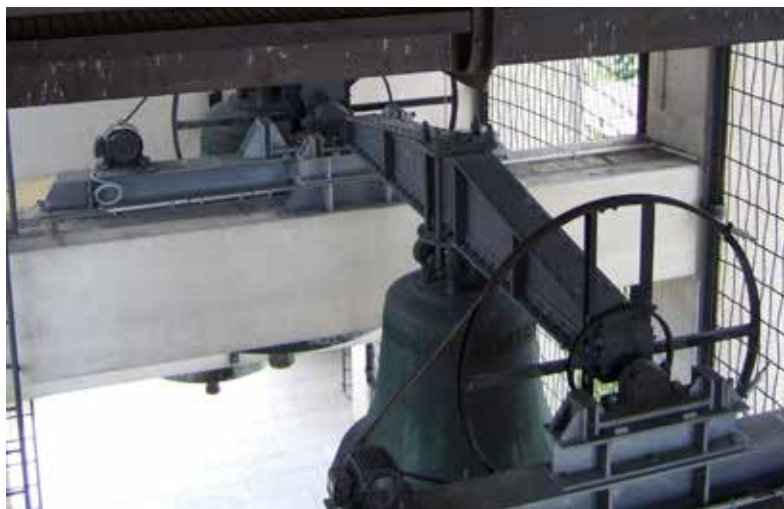
Die Glocken der Pauluskirche