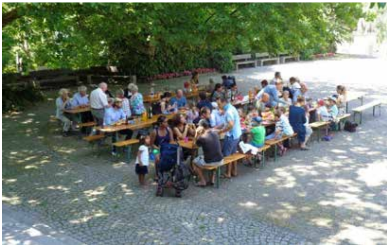
Familiensonntag 2018

Antwort klar: Es war ein normales Jahr. Ein Jahr, so besonders und gewöhnlich wie jedes andere auch: Ein Jahr mit Höhepunkten, und ein Jahr mit bewährten Angeboten. Ein