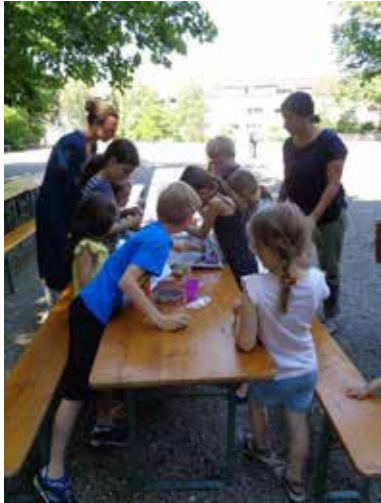
Basteln am Familiensonntag 2018

Das Jahr 2018 ist das letzte Jahr der Kirchgemeinde Paulus. War es also ein besonderes Jahr? Betrachtet man das Gemeindeleben, ist die